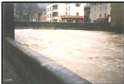
Avec la participation des habitants de la vallée de l'Albarine Nos remerciements aux Sapeurs-Pompiers Durée : 1h30

L'ALBARINE et la Crue centennale de la St Valentin (14 Février 1990)